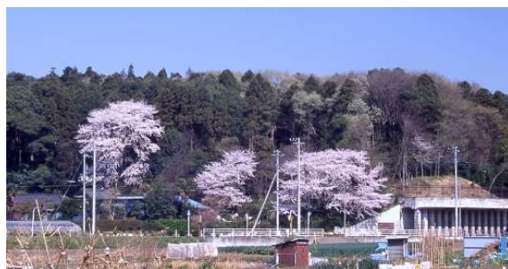
活動場所：根戸城址

開講期間：3月7日(土)から12月まで、毎月3回程度、土曜日(8時30分～12時00分) (都合のよい日だけの参加も可です)