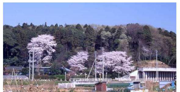
活動場所：根戸城址

開講期間：3月1日(土)から12月まで、毎月3回程度、土曜日(8時30分～12時00分) (都合のよい日だけの参加も可能です)